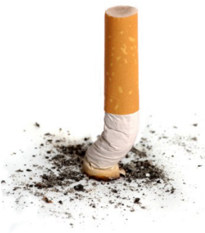
Bảo Trâm tổng hợp

Đối với những người hút thuốc, bỏ thuốc không phải điều dễ dàng, bởi thành phần chính trong thuốc lá là nicotine – chất gây nghiện. Bạn có thể mất thời gian để bỏ hút thuốc, nhưng đó là điều tốt nhất bạn có thể làm để bảo vệ sức khỏe và ngăn ngừa ung thư tuyến tụy.