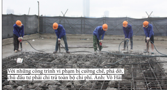
Với những công trình vi phạm bị cưỡng chế, phá dỡ, chủ đầu tư phải chi trả toàn bộ chi phí.

Nghị định 61/2018 có hiệu lực từ ngày 21/6 quy định với cán bộ, công chức, viên chức được giao nhiệm vụ hướng dẫn, tiếp nhận hồ sơ, giải quyết, trả kết quả giải quyết thủ tục hành chính theo cơ chế một cửa tại cơ